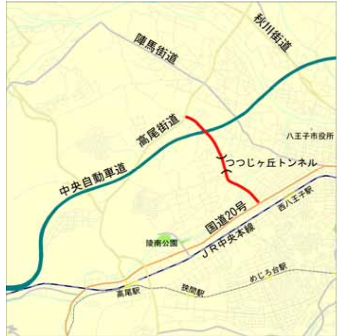
<< 位置図 >>

本事業は、「交通アクセス機能が飛躍的に向上、バス路線の開通による地域住民の利便性の向上に寄与したこと」また、「自然との調和を図ったトンネル坑口デザイン、丘陵地の景観を大切にした整備」が評価され、『第20回全国街路事業コンクール』において特別賞を受賞しました。