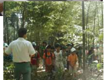
ワークショップの流れ