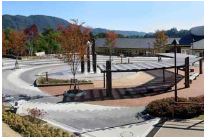
あいかわ公園 【神奈川県】

また、その役割も従来の憩いの場としての機能だけでなく、防災・福祉機能の充実を備える方向にあり、社会基盤としての重要度も高まっています。