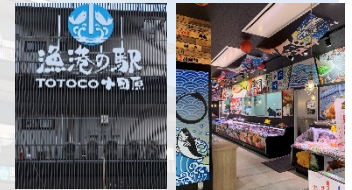
漁港の駅 TOTO CO 小田原

テナントを導入しやすいフレキシブルな設計、テナント事業者との工事等の調整など、ご提案します。